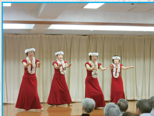
理容組合 芸能訪問 6 / 3